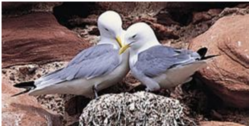
de kittiwake of drieteenmeeuw